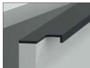
Maniglia COLIBRÌ INTRA COLIBRÌ INTRA handle